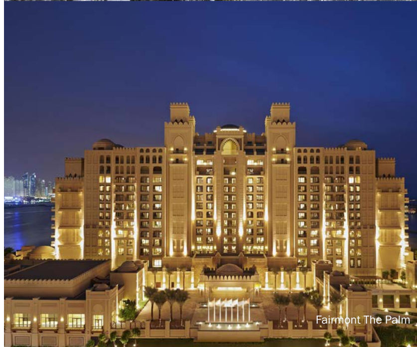
Fairmont The Palm