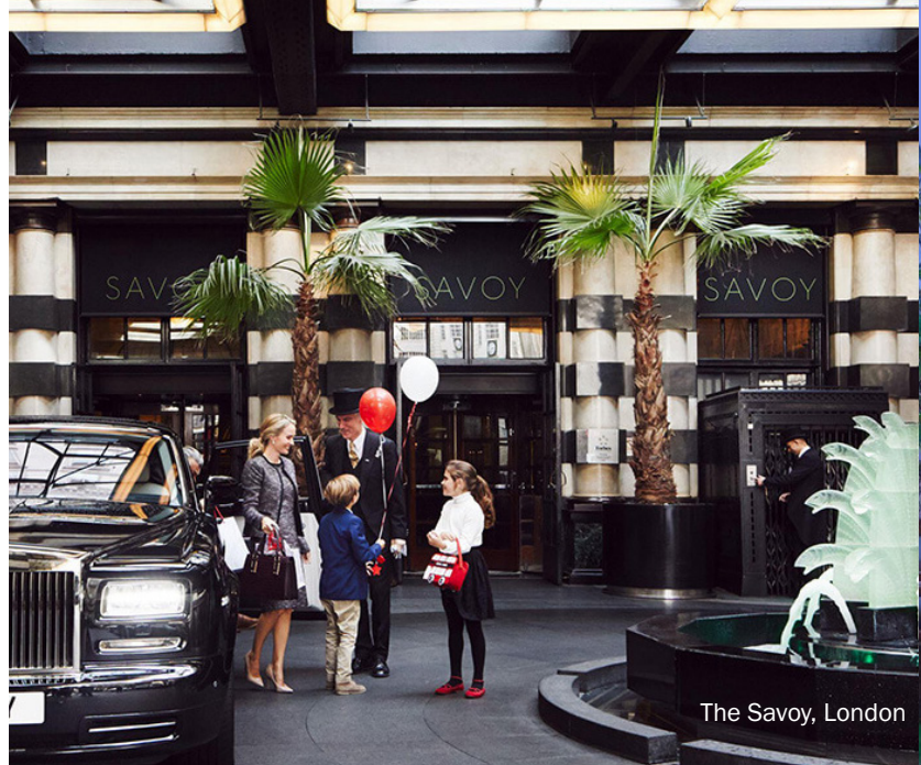
The Savoy, London