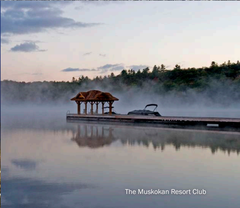
The Muskokan Resort Club