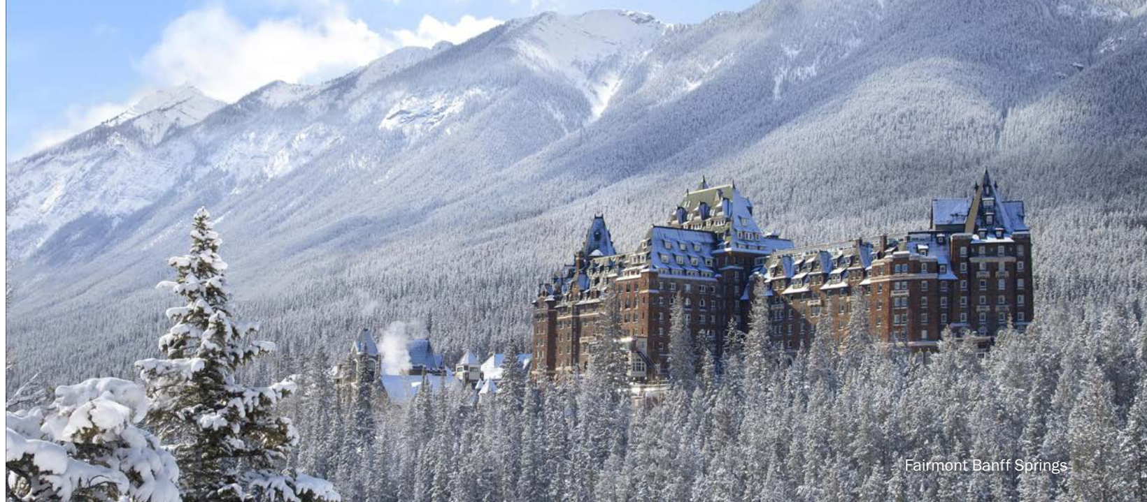
Fairmont Banff Springs